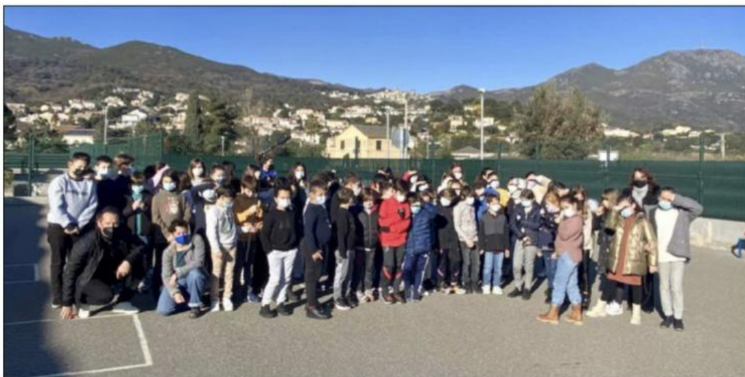
Dernière opération avec les enfants de l'école U Principellu et U Rustincu à Furiani.