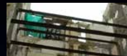
DU PLÂTRE BRUT