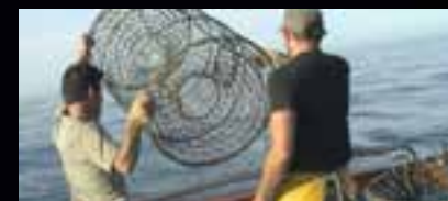
DONNE UN POISSON A UN HOMME

Documentaire : Alasthal Iyad - Musique : Tramini Laurence et Antoine - Texte poétique : Mahmoud Darwich - Production/Co-production : IUT de Corse DU CREATACC - G.R.E.C. - Durée : 23'16 - France - Corse - 2012.