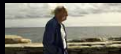
LES HORIZONS PERDUS

En Corse, Iyad, jeune palestinien rencontre Michel, un pêcheur et évoque avec lui son pays, la Palestine et ses misérables pêcheurs, le manque de liberté et la solidarité entre les peuples. Les textes de Mahmoud Darwich résonnent comme un écho pour établir le lien de proximité entre les deux rives.