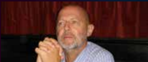
Dominique MAESTRATI Réalisateur et président du jury des films

Les sélections « MED et INTER » du 26 au 27 mars et le palmarès le 28 mars au cinéma ALBA à Corte