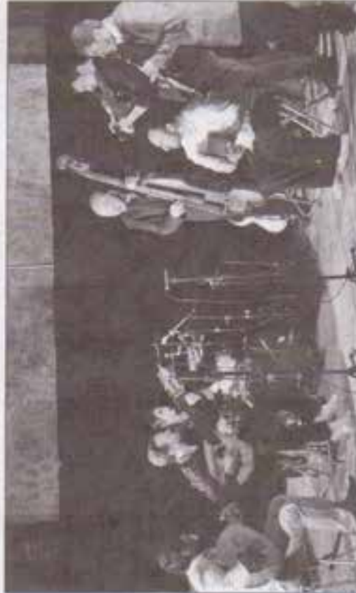
Alba, une formation musicale à nulla autre parcelle entre récréation et récréation constituée par d'excellents musiciens et chanteurs éminemment complètes.