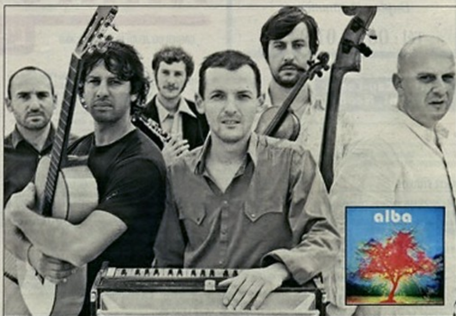
Avec son nouvel album Radiche Suprane, L'Alba prend le temps de s'attarder sur ces beautés que l'on ne voit plus. Un voyage au cœur des « racines célestes » insulaires.